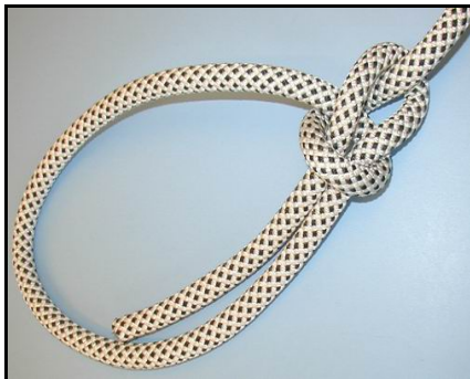
Der strammes op ved at trække i tampen.