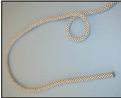
Der laves en stor bugt. På langtovets side af bugten laves et øje.