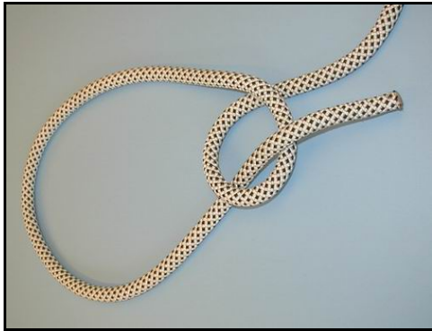
Tampen føres op gennem øjet ("op af søen")